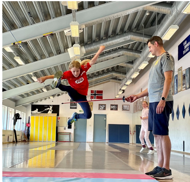
Fra Bygdø fekteklubbssommerleir.