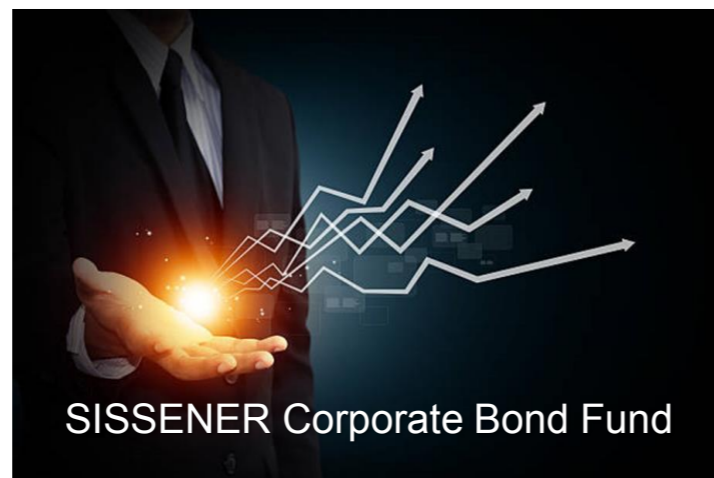
SISENER Corporate Bond Fund

Er man ute etter høyere avkastning enn tradisjonell innskuddsrente, men ønsker ikke å plassere alle sine investeringer i aksjer eller aksjefond. Da kan SISENER Corporate Bond Fund være et godt alternativ.