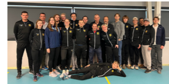
SVNM 2023: Bygdø Fektefamilie på NM